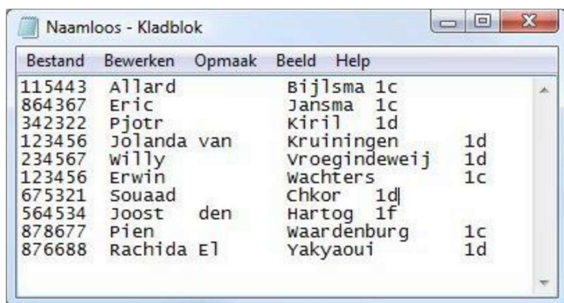
Figuur: Een cursist.lst kan ook in Microsoft Kladblok worden gemaakt. Let op de juiste tabs!

Omdat wij het mogelijk hebben gemaakt cursisten met een wachtwoord te laten inloggen, moet zo'n cursistlijst eigenlijk gecodeerd (= onleesbaar) worden opgeslagen. Dat kan echter alleen met WTCursist, onderdeel van het tabblad EduBouwdoos van de WinToets SUITE versie. Hoeft uw lijst niet gecodeerd te zijn dan is deze ook aan te maken vanuit een administratieprogramma of een programma zoals Kladblok of Excel. Schrijf dan het bestand weg als tab-gescheiden bestand.