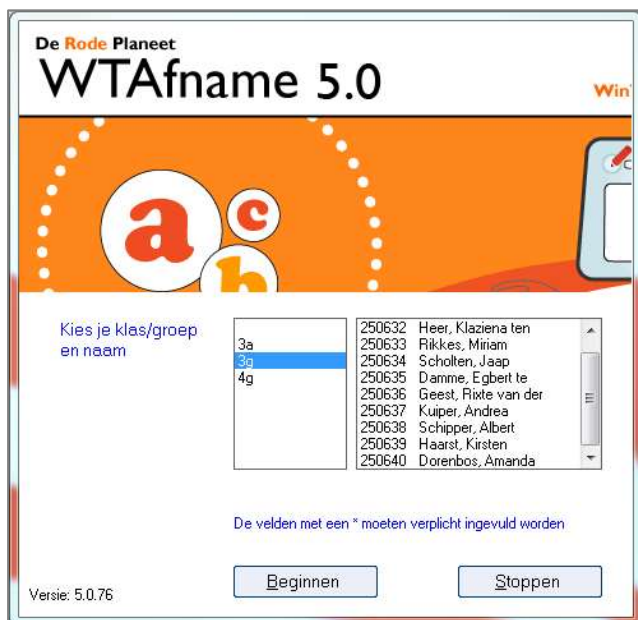
Figuur: Hier wordt ingelogd met behulp van een cursistlijst.

Met deze cursistlijst kunnen leerlingen zich aanmelden door hun naam uit een lijst te kiezen.