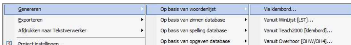
Figuur: Toets genereren op basis van een Lijst.