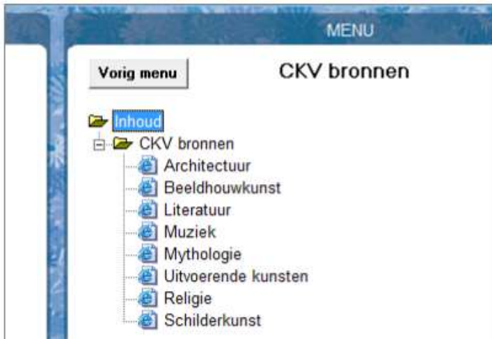
Figuur: Het submenu met weblinks. Via "Vorig menu" kan de cursist terugkeren naar het hoofdmenu.

De cursist kan dus te allen tijde relevante bronnen raadplegen tijdens het maken van de (oefen)toetsen.