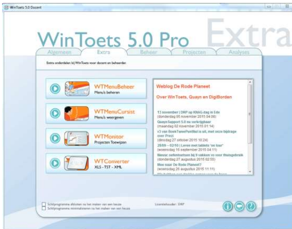
Figuur: Het onderdeel WMenuBeheer bevindt zich op het tabblad Extra van de schil.