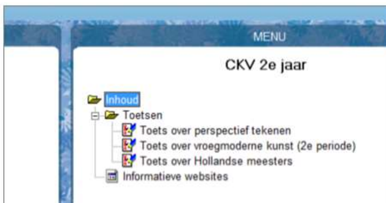
Figuur: Het CKV menu met toetsen en "Informatieve websites" als submenu.

Kies daarbij voor een geschikte omschrijving, bijvoorbeeld “Informatieve websites”. Het menu ziet er dan voor de cursisten, in WTMenuCursist zo uit: