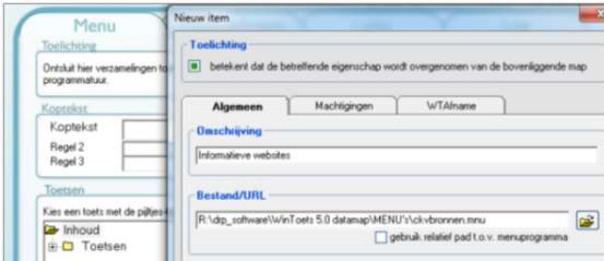
Figuur: Toevoegen van een item in WTMenuBeheer. Hier wordt het menu met weblinks (ckvbronnen.mnu) toegevoegd.

Kies daarbij voor een geschikte omschrijving, bijvoorbeeld “Informatieve websites”. Het menu ziet er dan voor de cursisten, in WTMenuCursist zo uit: